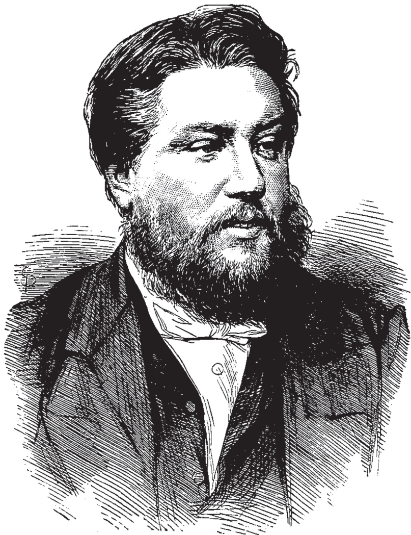
C. H. Spurgeon (1834–1892)