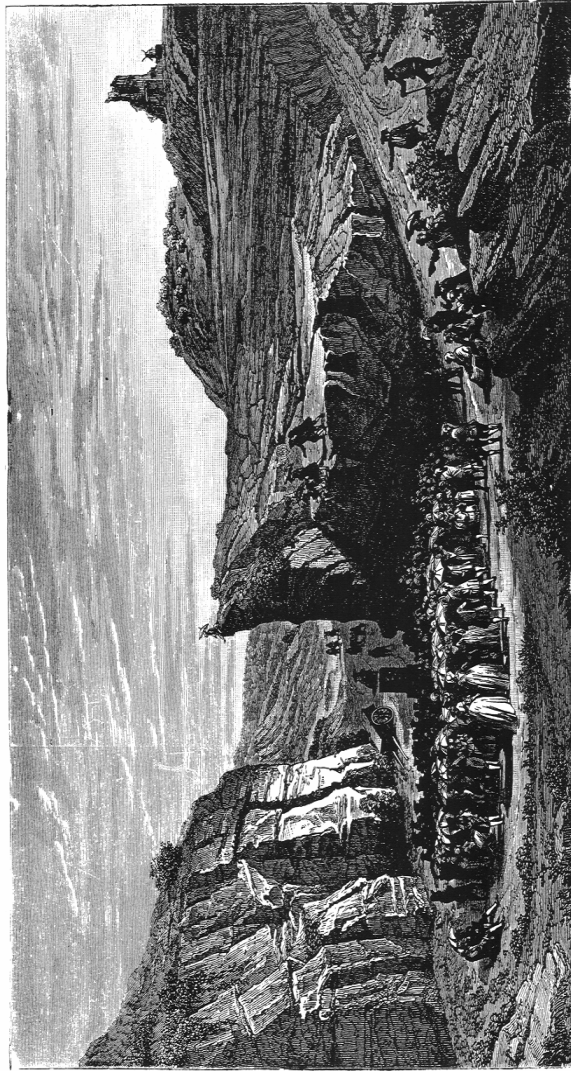
Eine Protestantenversammlung in den Gebirgen, zur Erinnerung an die Zeit der Verfolgung.