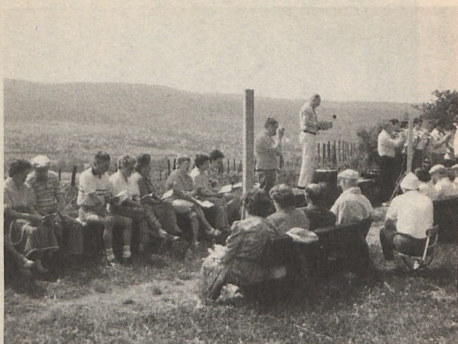
Als Gemeindepfarrer und Dekan im Remstal