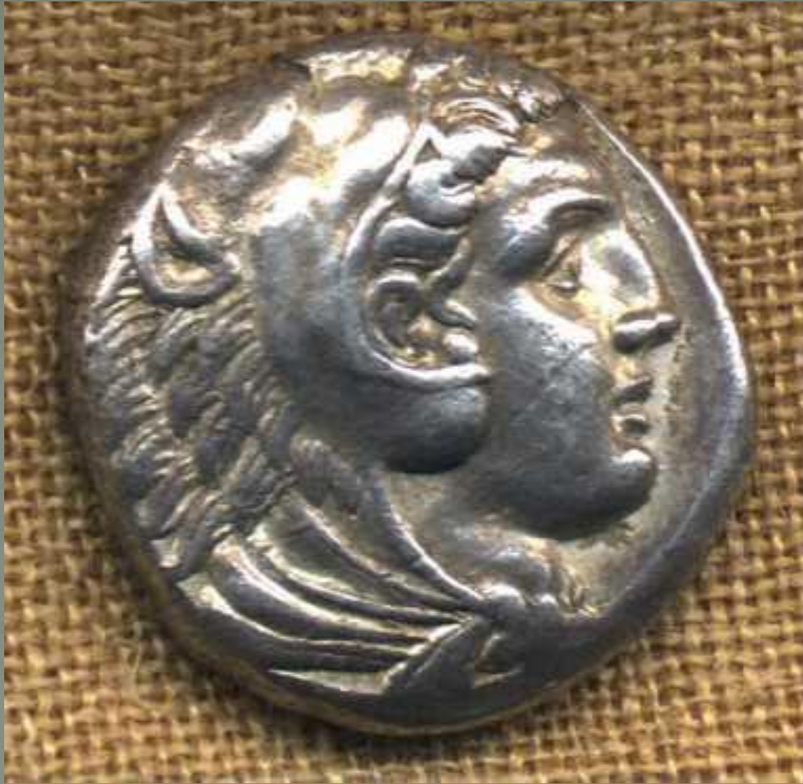
Alexander der Grosse (336 – 323 v. Chr.)