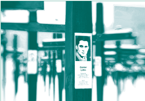
Gedenkstätte für die Toten, die an der innerdeutschen Grenze starben (Checkpoint Charlie, Berlin)

So versuchte beispielsweise der 18-jährige Maurer- geselle Peter Fechter im August 1962, also ein Jahr nach Errichtung der Mauer, sie in unmittelbarer Nähe des Checkpoints Charlie zu überqueren. Als er die Mauer schon erklommen hatte, wurde er von mehreren Schüssen getroffen, fiel zurück auf Ost- berliner Gebiet und blieb bewegungsunfähig im