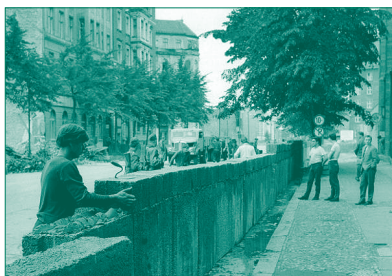
August 1961: Ostberliner Bauarbeiter bauen die Mauer entlang der Sektorengrenze unter den Augen von bewaffneten Volkspolizisten aus.

Dennoch begannen in der Nacht vom 12. auf den 13. August die NVA und Angehörige der Deutschen Grenzpolizei, die Straßen und Gleiswege nach Westberlin abzuriegeln. Sowjetische Truppen hielten sich in Gefechtsbereitschaft und waren an allen Grenzübergängen präsent. Jede bestehende Verkehrsverbindung zwischen den beiden Teilen Berlins wurde plötzlich unterbrochen.