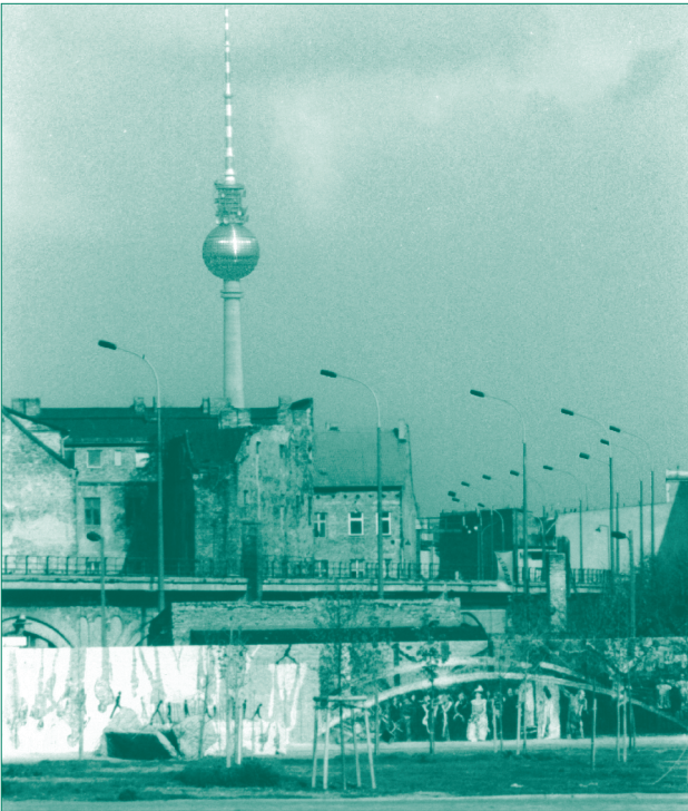
Berlin war jahrelang eine geteilte Stadt. Blick von Westberlin auf den Fernsehturm am Alexanderplatz in Ostberlin

Die Berliner Mauer war das markanteste und symbolträchtigste Stück der Grenze zwischen den Machtblöcken. Sie demonstrierte die Spaltung der deutschen Hauptstadt und des deutschen Volkes auf eindrucksvolle Weise und wurde zum Symbol einer geteilten Welt.