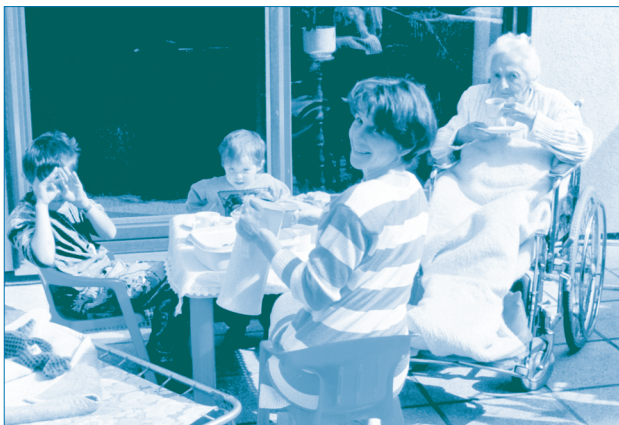
Im neuen Haus in Mörfelden mit der über 90-jährigen Oma