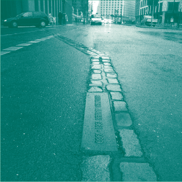
Berliner Mauer 1961-1989: Der Verlauf der ehemaligen Mauer wird durch Pflastersteine und Gedenkplatten markiert.

einigung ein langer Prozess. Heute, zwei Jahrzehnte nach dem Mauerfall, ist von der einstigen Trennung, die Berlin durchzog, nur noch wenig zu sehen.