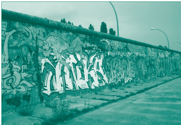
Die Mauer auf Westberliner Seite: beschmiert und besprüht

Die Berliner Mauer war zum Zeitpunkt des Mauerfalls einseitig bemalt und beschmiert. Für die Bürger aus Ostberlin war sie unzugänglich, aber die Westberliner konnten dicht an sie heran und verwandelten sie in ein kilometerlanges knallbuntes Schmierblatt. Obwohl das Malen an der Mauer offiziell nicht erlaubt war, da sie auf dem Staatsgebiet der DDR stand, forderte gerade die weiße Grundierung der 1975 neu aufgestellten Mauersegmente die Künstler in Berlin heraus, die Mauer als die längste Leinwand der Welt zu nutzen. Oft wurden jedoch die Graffiti und Inschriften innerhalb weniger Wochen wieder durch andere übermalt. So wurde die Mauer vielerorts zu einem wahllos beschmierten und besprühten Schandmal.