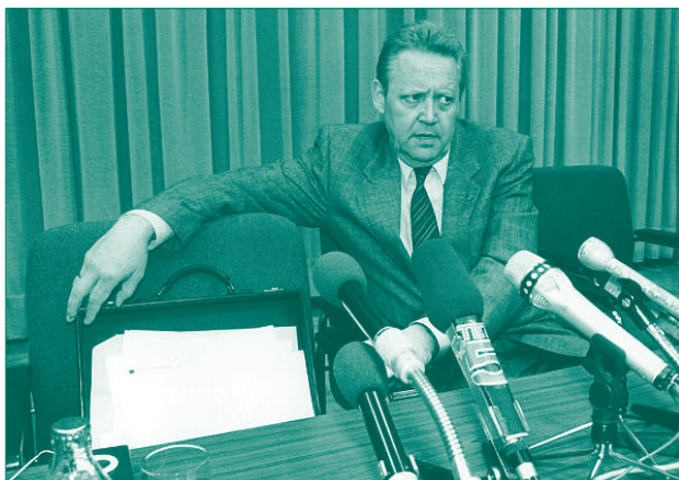
Günter Schabowski gibt die Öffnung der Grenze bekannt.

Auf einer Pressekonferenz im Internationalen Pressezentrum in der Ostberliner Mohrenstraße kam es am 9. November 1989 zur Sensation. SED-Politbüro-Mitglied Günter Schabowski stellte sich den Fragen der Journalisten. Ein italienischer Journalist interessierte sich für den neuen Reisegesetzentwurf. Schabowski erklärte, dass sich die Regierung dazu entschlossen habe, »heute eine Regelung zu treffen, die es jedem Bürger der DDR möglich macht, über Grenzübergangspunkte der DDR auszureisen«. Auf die Zwischenfrage, wann die neue Regelung denn in Kraft trete, sagte er, sichtlich verunsichert, um 18:57 Uhr: »Das tritt nach meiner Kenntnis ... ist das sofort, unverzüglich.«