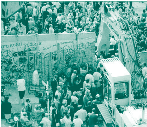
Juni 1990: Der Abriss der Berliner Mauer beginnt. Ein Bagger bringt erste Betonsegmente zu Fall (Ecke Bernauer Str./Ackerstr. in Westberlin).

Die innerdeutsche Trennung konnte nur aufgehoben werden, weil die Mauer geschunden und zerschlagen wurde. Erst durch ihren Abriss wurde die Wiedervereinigung ermöglicht.