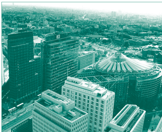
Der Potsdamer Platz in Berlin im September 2004

Für die Bundesrepublik markierte der 9. November 1989 den Beginn der Wende, die in der Wiedervereinigung am Tag der deutschen Einheit am 3. Oktober 1990 ihren Höhepunkt fand. In den folgenden Monaten und Jahren wurde dann diese Wiedervereinigung auch äußerlich zunehmend sichtbar. Die Zahl der typischen Trabis schwand rapide, die baufälligen, grauen Fassaden wurden saniert und in bunten Farben gestrichen. Viele der größtenteils maroden Straßen wurden mit einer glatten, neuen Asphalt-schicht überzogen. Auch wenn der Einigungsvertrag schlagartig in Kraft trat, war die Wiederver-