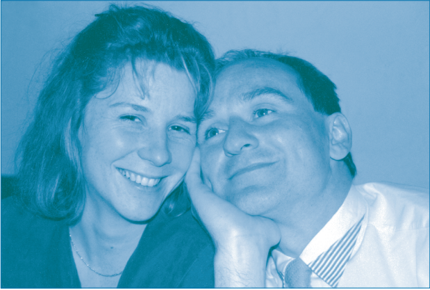
Bei der gemeinsamen Taufe

Wege ohne Gott war ich gegangen, und wie viel Schuld, wie viel Sünde hatte ich dadurch auf mich geladen. Es hielt mich nicht mehr auf meinem Stuhl, ich musste aufstehen und vor allen bekennen und bezeugen, dass auch ich zu Gott umkehren wollte. Es war sehr still im Raum, mein Herz klopfte laut, aber als ich es herausgebracht hatte, fühlte ich eine große Erleichterung und Freude. Meine Frau hatte kurz vorher den Saal verlassen, weil sie sich um die Kinder kümmern musste. Als sie zurückkam, strahlten alle sie so an – sie hatte nicht mitbekommen, dass ich gerade Jesus Christus in mein Leben gelassen hatte.