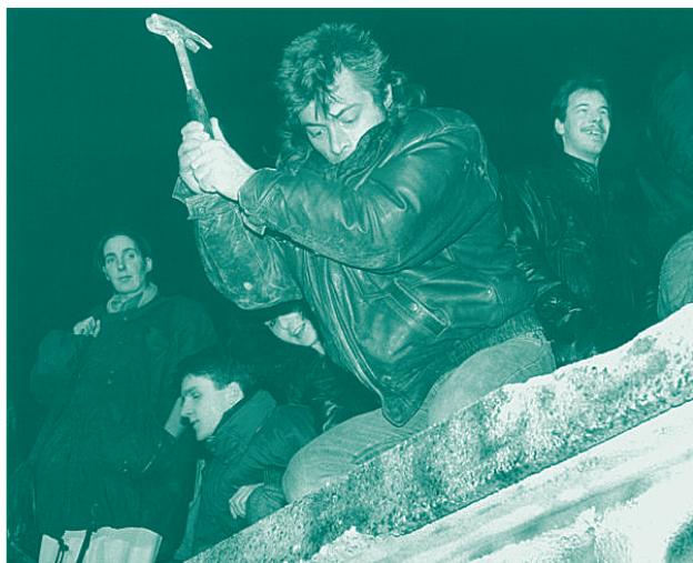
Ein »Mauerspecht« bei der Arbeit

Nur zwei Jahre zuvor, am 12. Juni 1987, hatte der damalige US-Präsident Ronald Reagan vor dem Bran-