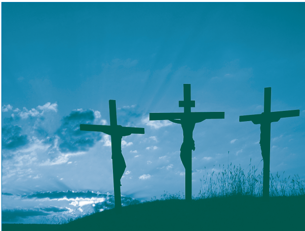
Jesus Christus stirbt am Kreuz – ein Tag mit gewaltigen Folgen.

Vor fast 2000 Jahren gab es einen Tag, an dem ebenfalls eine Mauer fiel und an dem ein Vorhang buchstäblich zerriss. Auch das war ein historischer Tag, der die Geschichte geprägt hat wie kein anderer. Menschen, die Augenzeugen der Ereignisse jenes Tages waren, haben sie ihr Leben lang nicht vergessen, ja, noch mehr, ihr Leben wurde davon völlig umgekrempelt. Was an diesem Tag passiert ist und welche Bedeutung die Ereignisse für uns heute haben, wird auf den nächsten blauen Seiten deutlich werden.