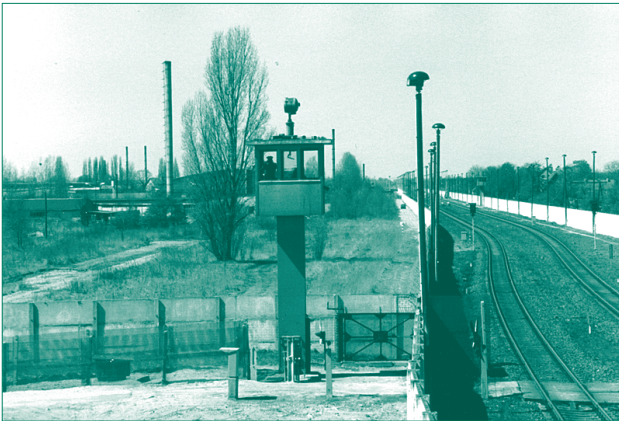
Grenzsicherung der Berliner Mauer in Berlin-Staaken

Das DDR-Regime zeigte eine unmenschliche Perfektion in der Absicherung der innerdeutschen Grenze und erwartete von den Grenzsoldaten erbarmungsloses Vorgehen gegen jeden Flüchtling.