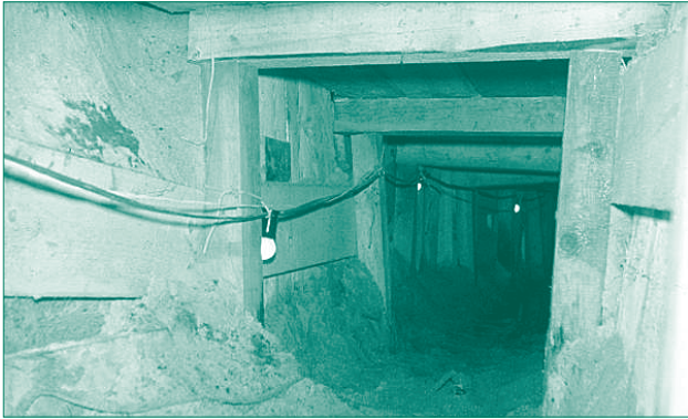
Fluchttunnel unter der Berliner Mauer (1963). Der nur 60 bis 80 Zentimeter hohe Tunnel wurde mit Holzbohlen abgestützt, um ein Einstürzen zu verhindern. Der Schlauch diente der Frischluftzufuhr.

Todesstreifen liegen. Niemand kam ihm zur Hilfe, obwohl er mit aller Kraft um Hilfe schrie. Schließlich erlag er seinen schweren Verletzungen.