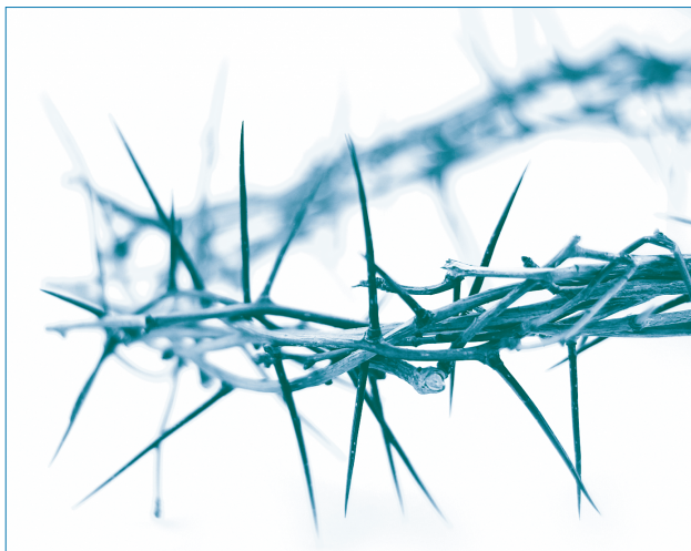
Jesus Christus ließ sich für uns misshandeln.

Der mit großer Gewalt zerrissene Vorhang zeigte, dass für die Wiederherstellung der Gemeinschaft mit Gott ein Opfer erforderlich war. Dass Jesus sei-