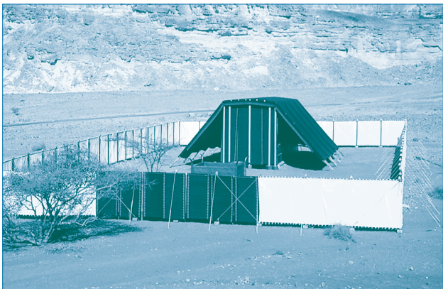
Modell der Stiftshütte in Originalgröße (Timna-Park, Israel)

Der Vorhang, der vor 2000 Jahren riss, hatte beeindruckende Ausmaße: Er war rund 18 m hoch und mehr als 4 cm dick – eine gewaltige textile Barriere. Er hing im jüdischen Tempel, der in Jerusalem das gottesdienstliche Zentrum der Juden markierte. Der Bauplan dieses Tempels entsprang dem Aufbau der Stiftshütte, des Zeltes, das schon Mose viele Hundert Jahre zuvor gebaut hatte. Von diesem »Zelt der Begegnung« hatte Gott gesagt, dass er dort mitten unter seinem Volk wohnen wollte. Dass aber mitten im Tempel ein Vorhang hing, erscheint ungewöhnlich. Worin bestand sein Zweck? Dieser schwere, trennende Vorhang hatte symbolträchtige Bedeutung. Denn durch ihn sollte eine scharfe