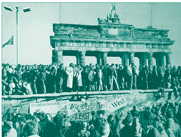
Die Berliner Mauer fällt – ein Tag von historischer Bedeutung.

Am 9. November 1989 fiel die Berliner Mauer, das zentrale Monument des Kalten Krieges und Sinnbild des »Eisernen Vorhangs«, der die Welt in zwei Teile teilte. Dieser Tag markierte den Anfang vom Ende der DDR und leitete die Wiedervereinigung Deutschlands ein – ein Tag von historischer Bedeutung. Tausenden von Menschen, die in dieser Nacht die dramatischen Ereignisse in Berlin hautnah miterlebt haben, werden diese Eindrücke ihr Leben lang in Erinnerung bleiben. Auf den nächsten grünen Seiten sollen einige Hintergründe zur Entstehung und zum Fall der Mauer skizziert werden.